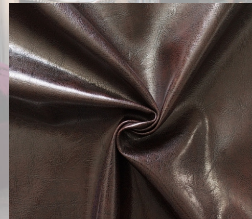
Victoria dark brown

Безупречная ткань для совершенного интерьера!