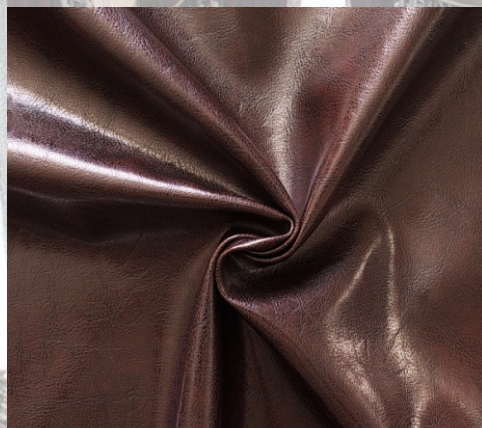
Victoria red brown